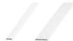
MOULURES À VERRE