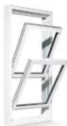
FENÊTRE À GUILLOTINE DOUBLE