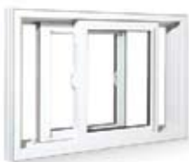
FENÊTRE COULISSANTE DOUBLE

Système multichambre assurant l'isolation thermique et sonore